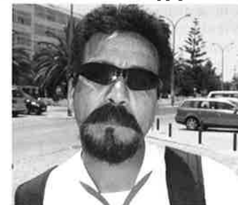
Kjenner noen denne mannen ?!

Rimelige billetter (etter forholdene) med TAP Portugal endte i første omgang i Lisboa, der vi hadde drøye timer før avgang til lille Faro lenger syd – og på toppen av det hele så ble det stor forsinkelse fra Lisboa, og våre staute karer (spesielt) så etter hvert mer ut som slakt spredt rundt på flyplassen.