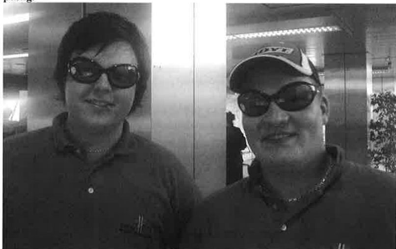
Kule gutter !

Vi hadde ingen ambisjoner om å lære noen å skyte mens de var i Portugal; det gikk mer på å få dem på rett spor i å gjøre sine "arbeidsoppgaver" i mer pressede og nye omgivelser. Vi snakket litt om målsettinger; noen hadde arbeidsmål mens andre tenkte poeng.