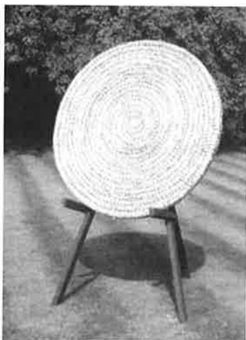
Mattene leveres i 130cm 85cm og 65cm

P.G.A Stor etterspørsel etter Egertec skytematter i år, ønsker vi att de klubber som vil ha matter levert i april/mai om å bestille disse så snart som mulig og før utgangen av Desember 2007.