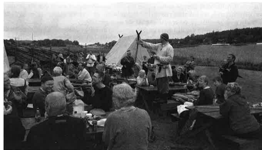
Og selve "etegildet" hører jo naturligvis med.....