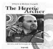
Heretic Archer 490,-