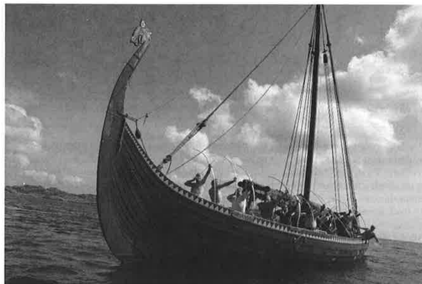
Som en del av et kulturarrangement, hører jo både vikinger og vikingskip med til historien.

Dermed dro en del dit, og andre valgte Fredrikstad og NBF-gull.