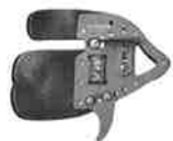
Soma Tab 495,-

Egertec matter er de beste alternativet når det gjelder holdbarhet, effektivitet og økonomi.