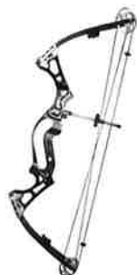
Merlin XV – moderne rask bue – hybridet med draglengdemoduler