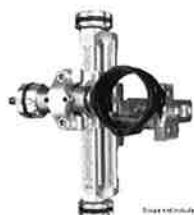
Merlin Tri-axis comp sikte