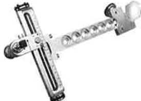
Merlin Classic recurve sikte