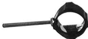
Merlin compound scope