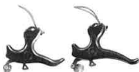
Merlin 2 og 3 finger release