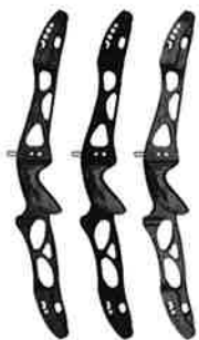
Merlin recurve midstykke – velbalansert og justérbar