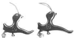
Merlin 2 og 3 finger release