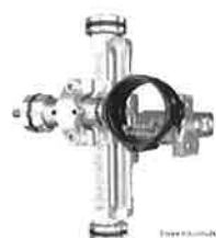
Merlin Tri-axis comp sikte