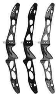
Merlin recurve midtstykke – velbalansert og justerbar