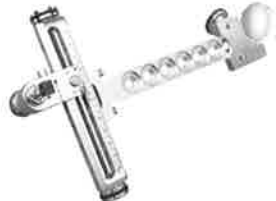
Merlin Classic recurve sikte