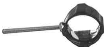
Merlin compound scope