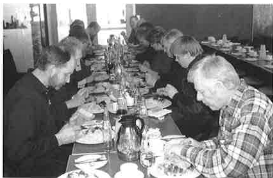
Så avsluttet man med en lunch før man tok fatt på hjemveien....