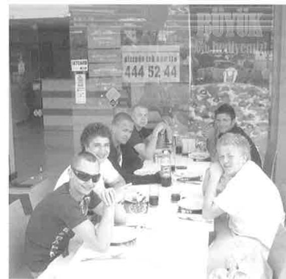
Norsk tropp på "skyggesiden" i Tyrkia.