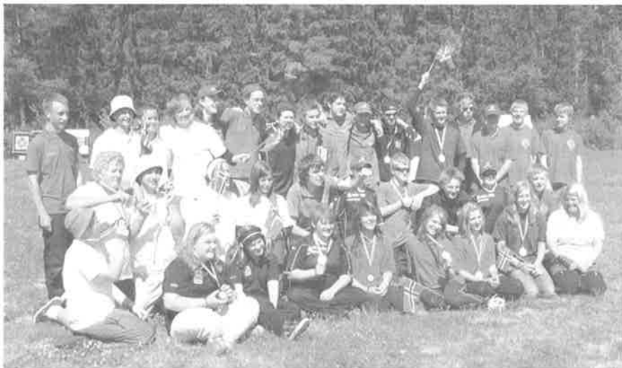
En glad og forholdsvis stor tropp fra Norge satte farge på mesterskapet !