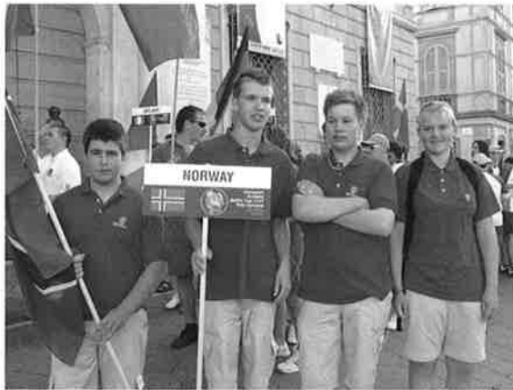
Norske ungdommer klar for innmarsj under åpningen.....

På kvelden var det åpningsseremoni med opptog og besøk på festningen i byen.