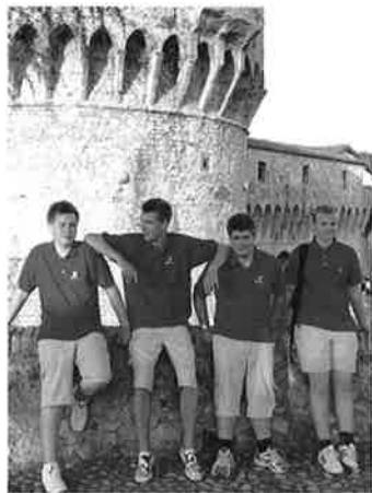
Det ble plass til litt sightseeing også.....