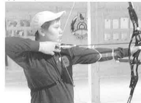
Christoffer Furnes (ark.foto) forsvarte de norske fargene i Oulo.