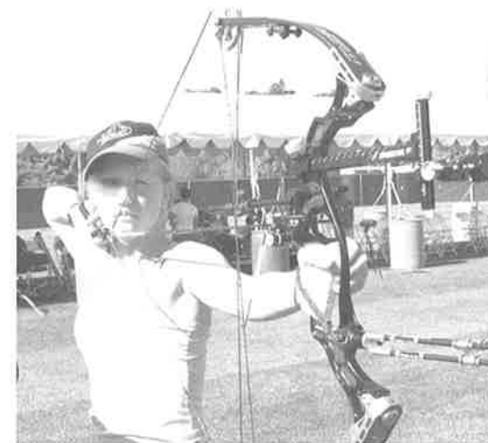
Runa skjøt glimrende, men hadde maksimal uflaks da buen sprakk i første match.....

Pifarre, men tapte for Lu Xing fra Kina, 99-105. Xing vant senere bronse. Jarl møtte James Mortlock fra Storbritannia som var nr. 26 innledende, i neste finale. Jarl vant med to poeng, men i neste match kom han til kort mot franske Fioretti 101-105. Jarl endte til slutt som nr 26, best av de norske skytterne. Vette skjøt en god 1/32-finale mot Klaus von Behr fra Brasil, men det endte 104-104 og de måtte ut i shoot off. Vette vant knepent 8 – 7. Dessverre ble det tap 99-104 mot Camilo Mayr og en 29. plass for Vette. Marit skjøt sin første finale mot Jhoaneth Leal. Det ble en jevn match, men det ble tap 104-106. Marit ble 19 til slutt. Marius var nestemann ut mot Srinet fra India, men det gikk ikke helt veien. Runa møtte danske Ida Frandsen. De tre første pilene gikk under blinken, og en nærmere undersøkelse av buen viste at den øvre lemme hadde sprukket.