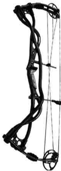
Hoyt Carbon Matrix