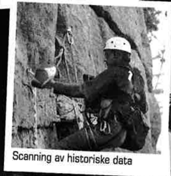
Scanning av historiske data