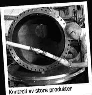
Kontroll av store produkter