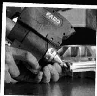
Kontroll/scanning av mindre deler