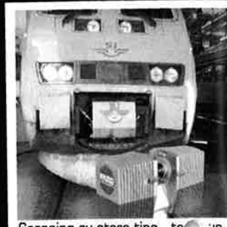
Scanning av store ting - to US, industrilokaler mm