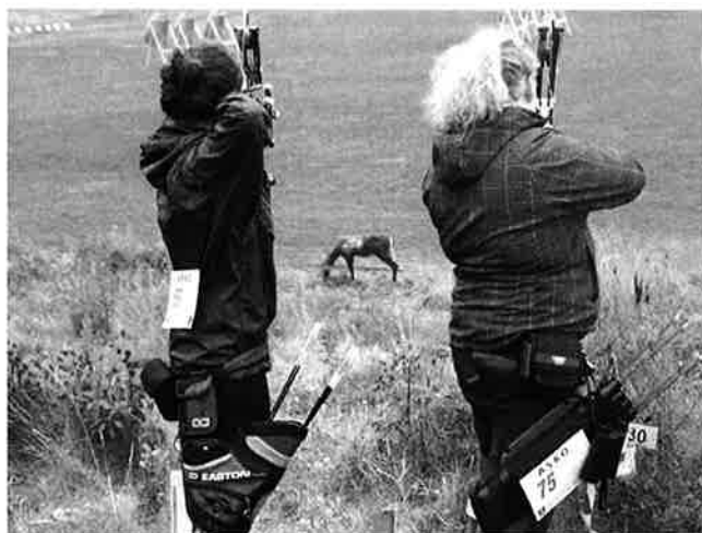
Kadettjenter på hjortejakt!