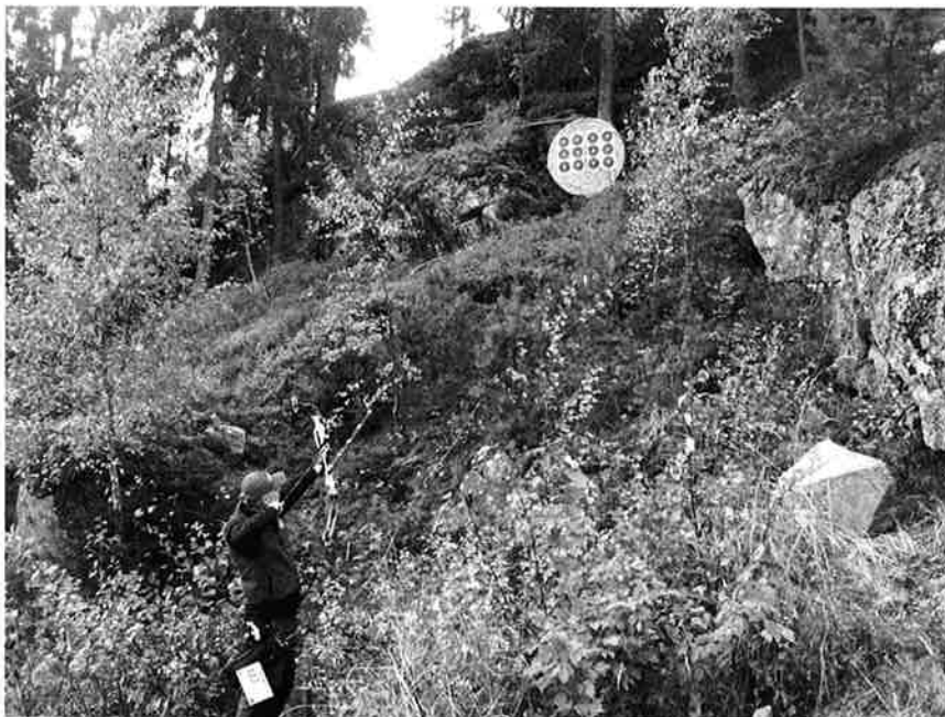
Kort hold – men ikke så lett likevel...

Og så synes mange det var kjekt at Trond Kvitnes, Moss, endelig fikk full uttelling av sin satsing og mange stevnestarter og tok gullet i tradklassen.