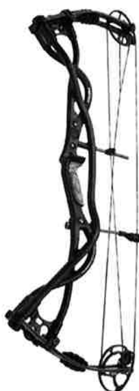
Hoyt Carbon Matrix