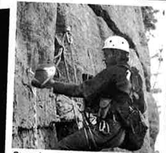
Scanning av historiske data