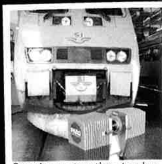
Scanning av store ting - tog, hus, industrilokaler mm