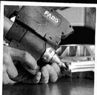
Kontrull/scanning av mindre deler