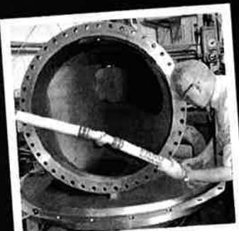
Kontrull av store produkter