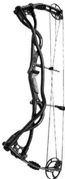
Hoyt Carbon Matrix